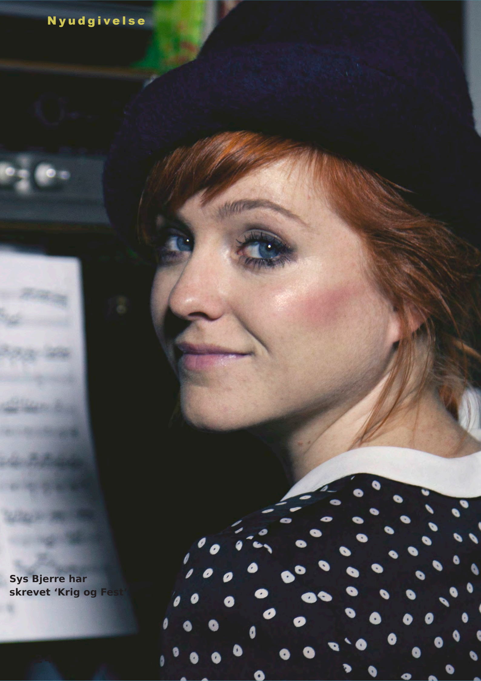
Sys Bjerre har skrevet 'Krig og Fest'