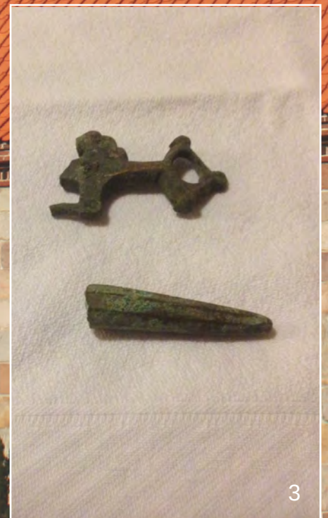
1: En Limoges-figur. 2: Et kig ned i krypten. 3: Der blev fundet flere metalgenstande. Bl.a. fra et hestesetøj fra 1000-tallet.