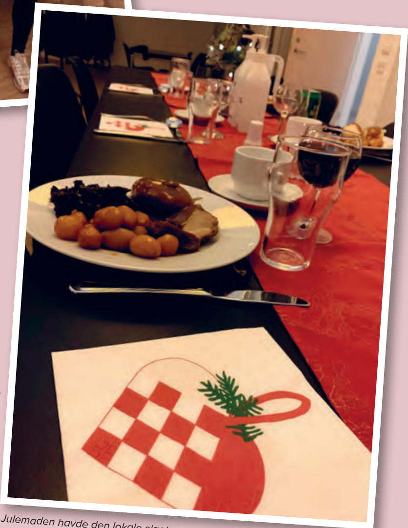
Julemaden havde den lokale slagter sørget for.