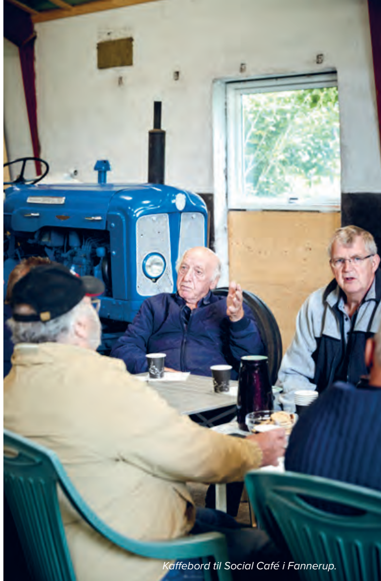
Kaffebord til Social Café i Fannerup.

“Coronatiden har efterladt mange trængte, og ensomhed er desværre noget, jeg ser ofte. Ikke alle har nødvendigvis modet eller kræfterne til at gå ud og op-søge nye relationer eller deltage i sociale aktiviteter.