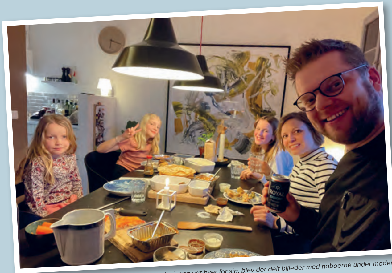
Selvom spisningen var hver for sig, blev der delt billeder med naboerne under maden.