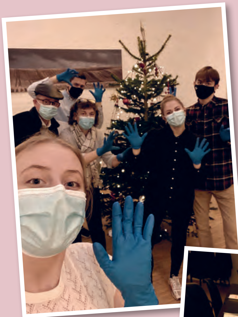
Det var juleaften i en corona-tid, så der var sørget for håndsprit og god afstand.