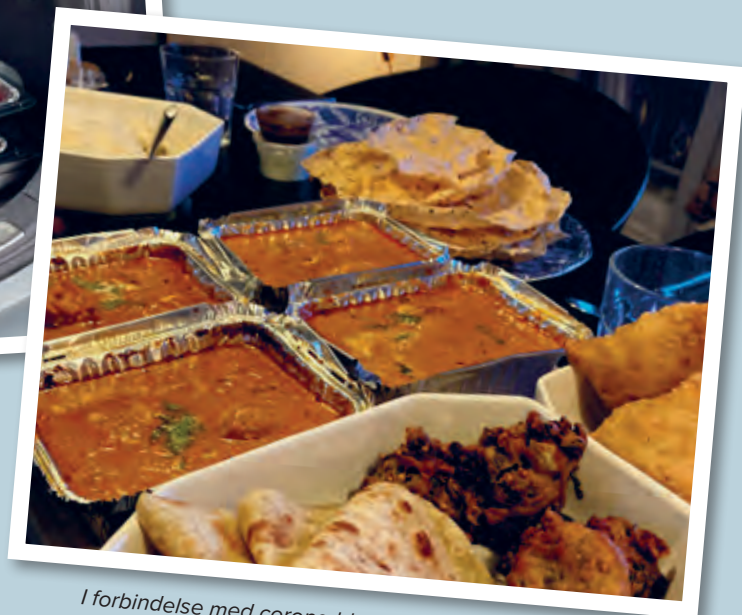
I forbindelse med corona blev maden taget med hjem og man spiste hver for sig. Efter corona er fællesspisningen tilbage.