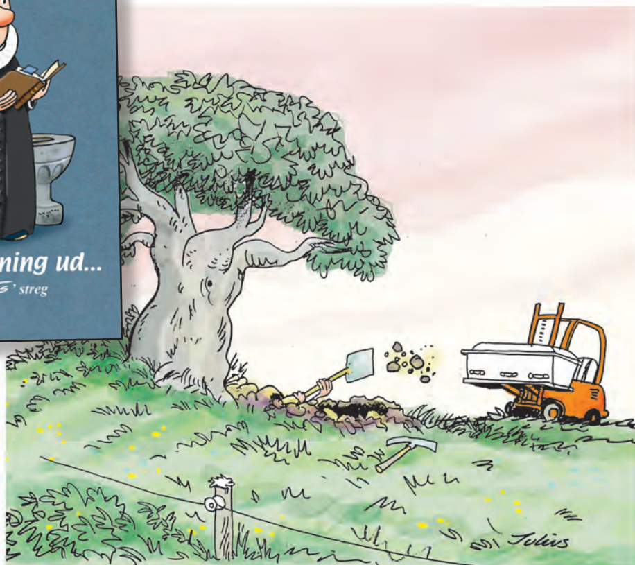
Folk er begyndt at reagere på de dyre begravelser.